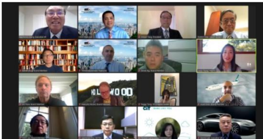
南加州香港商会第31届会员大会。

当日主讲嘉宾香港驻三藩市经济贸易办事处处长曾舜雯女士，和大家分享了新型冠状病毒病在香港的最新情况，以及从美国入境香港须知，更多详情可参阅以下的资讯网页：