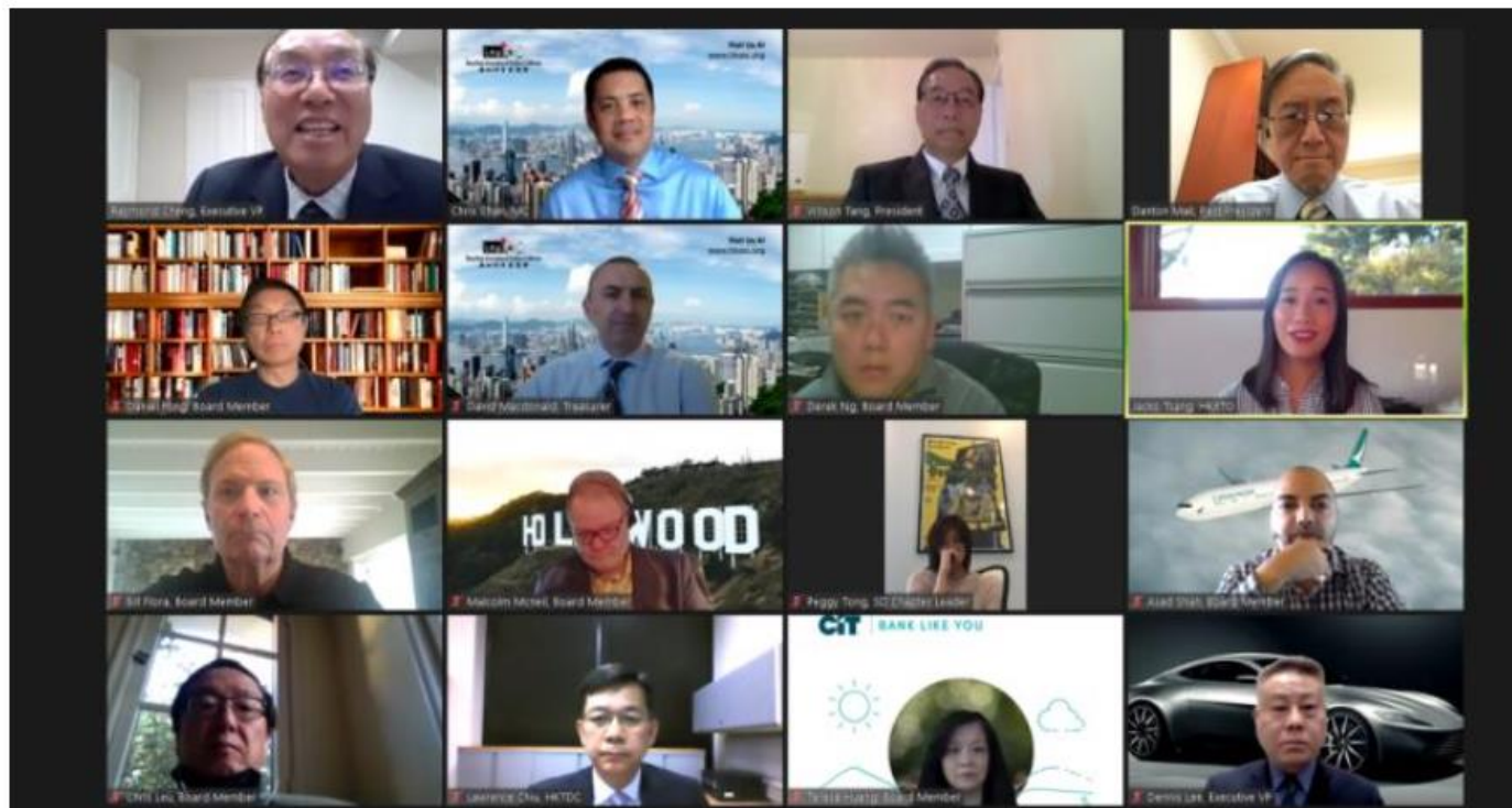
南加州香港商會第三十一屆會員大會，分享香港和美國營商資訊、Gen Z及千禧世代的營商理念，以創造更好新常態。