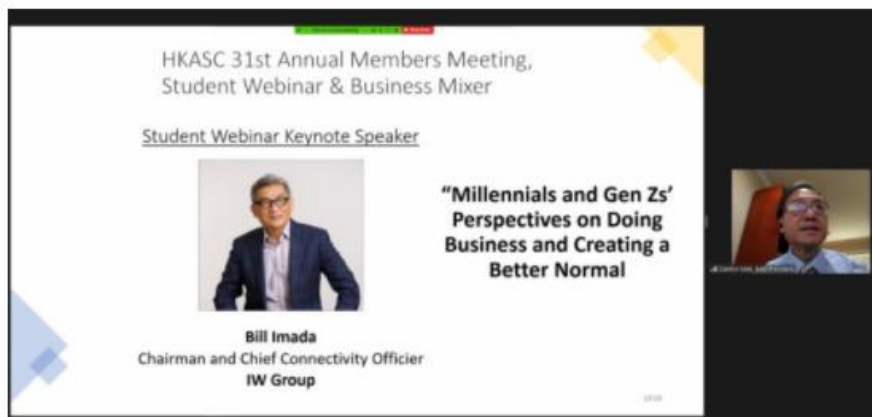
南加州香港商会第31届会员大会。